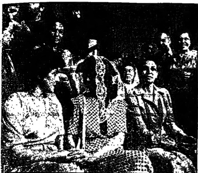
عقيلة رئيس الدولة السيدة اوفيرا ناسون في الكنيس اليهودي في شارع عتلي بك .